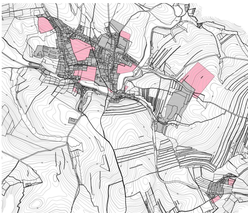
Obr. 1: Zastavitelné plochy vymezené ÚP.

Následující tabulka byla zhotovena podle údajů doložených z registru stavebního úřadu a po konzultaci se starostou obce Bory.