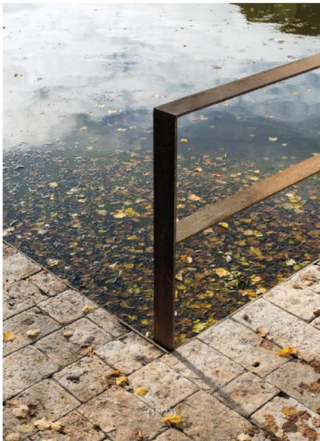
ZÁBRADLÍ NA ZÍDCE