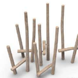
Tráva / herní prvek