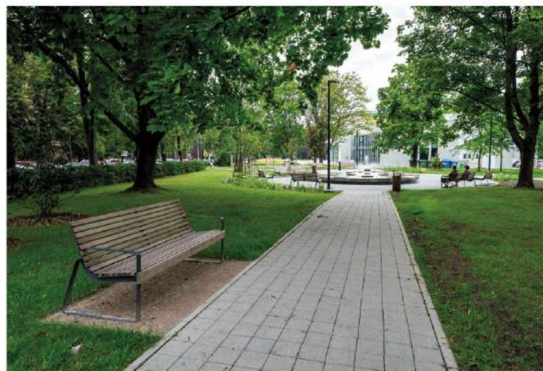
ZPEVNĚNÁ PLOCHA - BETONOVÉ DLAŽDICE BEZBARIÉROVÉ