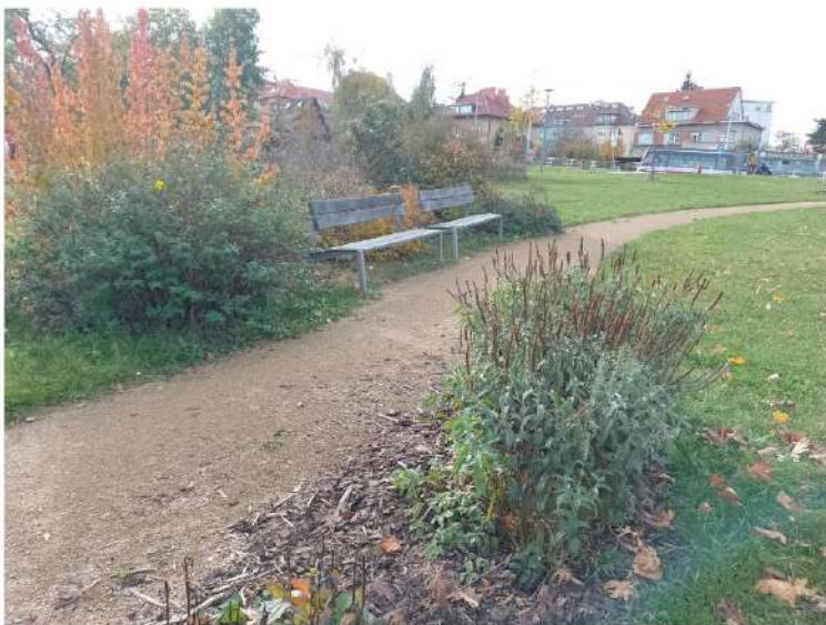
SKLENÉ NAD OSLAVOU - STUDIE