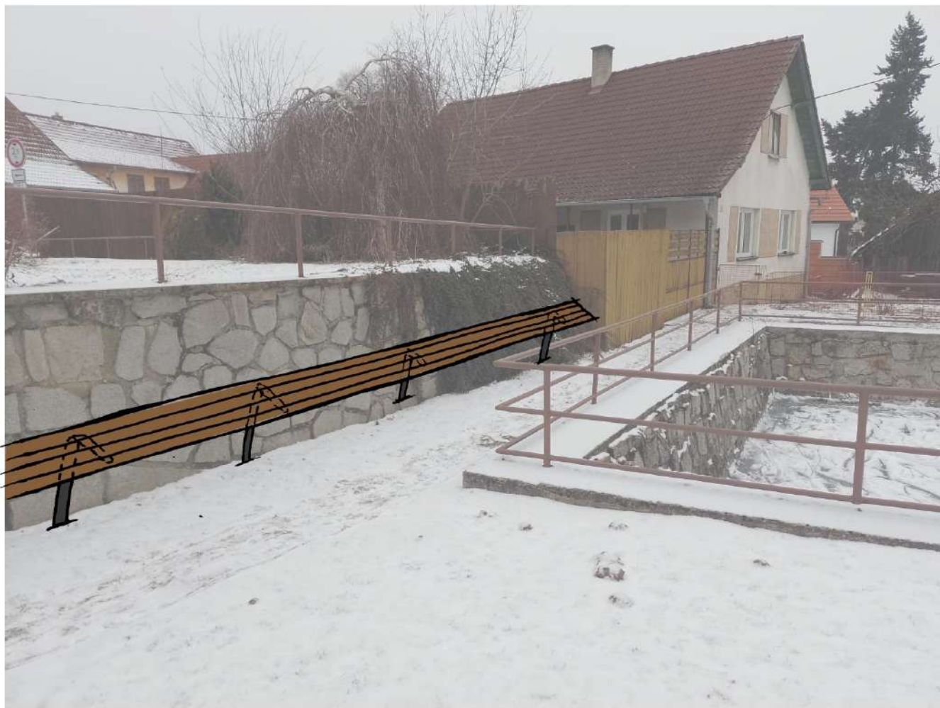
LAVIČKA PODÉL ZÍDKY - PRKNA NA NOSNÍCÍCH V BARVĚ ANTRACITU UPEVNĚNÝCH NA ZÍDKU