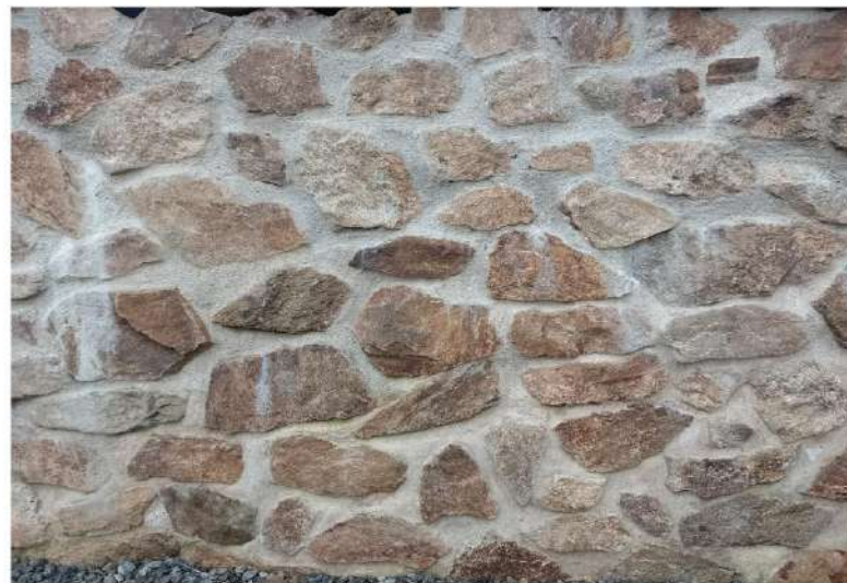
VYSPÁROVANÁ KAMENNÁ ZÍDKA